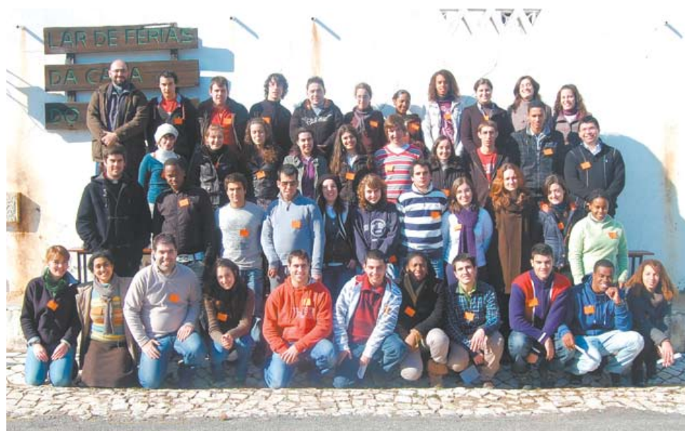
Convívio-Fraterno n.º 1126 da diocese de Setúbal

Realizou-se nos dias 13, 14 e 15 de Fevereiro, no Lar de Férias da Casa do Gaiato, no Portinho da Arrábida o Convívio Fraterno 1126 para jovens da Diocese de Setúbal.