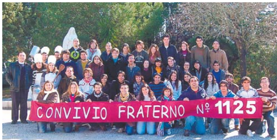
Convívio-Fraterno n.º 1125 da diocese do Algarve

Foi isso que os 31 jovens que participaram no Convívio Fraterno nº 1125 para a Diocese do Algarve fizeram, nos passados dias 12, 13, 14 e 15 de Fevereiro. Aquelas três dezenas de jovens, oriundos de várias paróquias da Diocese, aceitaram o desafio de se deixarem guiar, e seguindo o caminho do amor deixaram-se apaixonar por Jesus Cristo!