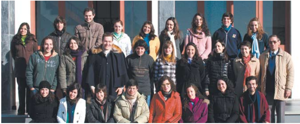
Convívio-Fraterno n.º 1124 da diocese de Portalegre e Castelo Branco

Numa altura marcada pela folia e festas carnavalescas, aceitar o desafio para retirar as máscaras e sermos nós próprios, pode ser muito complicado. Mas, houve quinze novos convivas, que sem receio o fizeram e aceitaram o apelo de estar mais próximo Dele.