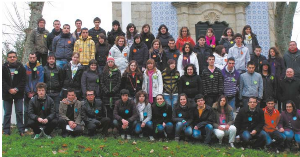
Convívio-Fraterno n.º 1119 da Diocese de Bragança

Apesar do frio e da neve que pintou de branco muitos pontos do distrito de Bragança, o tempo do Advento, nesta diocese, ficou marcado por três dias muito especiais. Assim, a 17 de Dezembro de 2009, deu-se início ao Convívio Fraterno número 1119. Um número que será sempre especial para os 37 jovens que aceitaram o desafio da descoberta e que, largando o calor e o conforto das suas casas, optaram por entrar numa aventura em tudo diferente daquelas que já haviam experimentado. No meio de uma sociedade anestesiada pela falta de tempo para pensar em questões essenciais à felicidade e ao sentido da vida humana, um Convívio Fraterno dá aos jovens a oportunidade de parar e de reflectir sobre estas questões, orientando e incentivando a uma vida centrada em Jesus Cristo.