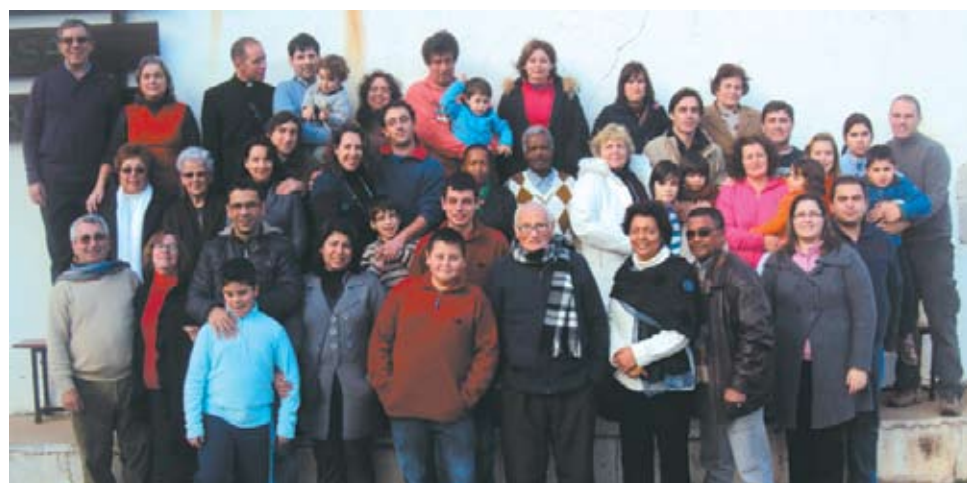
Convívio-Fraterno n.º 36 par casais da diocese de Setúbal

Quando nos disponibilizamos para servir Jesus na sua igreja, Ele faz-nos seus instrumentos para que o seu amor salvador encha o coração daqueles que o procuram.