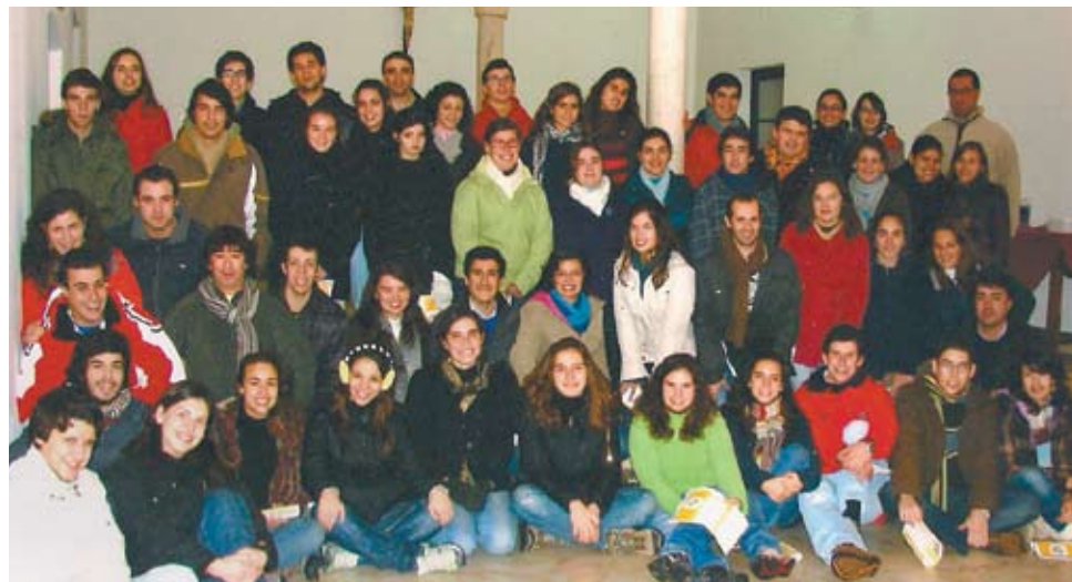
Convívio-Fraterno n.º 1122 da diocese de Évora

Num espaço de harmoniosa serenidade alentejana, o seminário menor de Vila Viçosa proporcionou-nos uma verdadeira oportunidade de intimidade com Cristo.