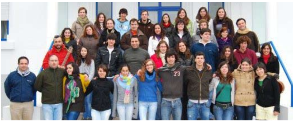
Convívio-Fraterno n.º 1121 da diocese de Santarém

O CF 1121, na diocese de Santarém, decorreu em Torres Novas de 26 a 29 de Dezembro 2009, prontos a celebrar o Natal do Senhor que se fez Homem. E haveria melhor forma de preparar o coração para essa celebração? Em conjunto com os elementos das equipas, os 23 Novos tiveram a oportunidade de acolher a Cristo e com Ele o seu amor por nós.