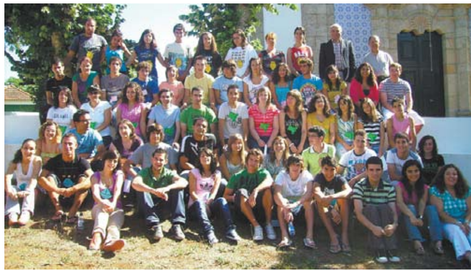
Convívio-Fraterno n.º 1107 da Diocese de Bragança

Com o passar do tempo, foi espicaçado aos jovens uma vontade enorme de conhecer Deus, foi plantada uma semente de Deus que foi germinando ao longo deste convívio e terá de ser regada ao longo da nossa vida. Para que viva dentro de nós, para que cresça nos corações vazios destes jovens do século XXI, que estão enraizados da maior materialidade que se faz sentir neste mundo de aparências, neste mundo difícil e cheio de tentações de hoje. Foi o regressar do filho pródigo à casa do Pai, foi um amor de um Pai que jamais acabará e uma Mãe que nos acompanha e que terá sempre um colo acolhedor e carinhoso para descansar.