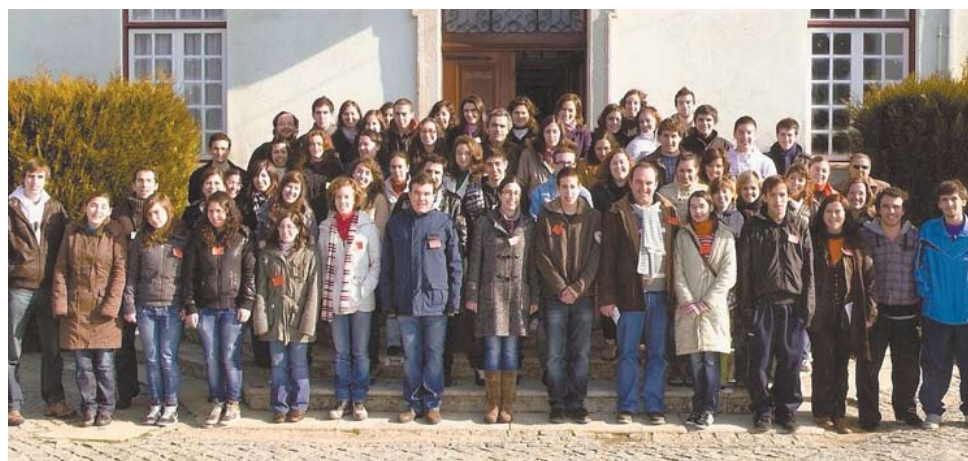
Convívio-Fraterno n.º 1123 da diocese da Guarda

Foi no passado fim-de-semana de 12 a 15 de Fevereiro que 40 jovens, da Diocese mais alta de Portugal (a Guarda para os mais distraídos), se reuniram no Seminário Menor do Fundão, para viverem a “calorífica” experiência do Convívio Fraterno, com o número de 1123.