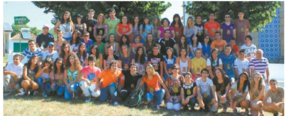
Convívio-Fraterno n.º 1130 da diocese de Bragança

Foi no dia 30 de Julho à noite, após um dia de calor abrasador, que se deu início ao Convívio Fraterno número 1130 na diocese de Bragança. Como um grito de revolta perante uma sociedade sem claros ideais, mergulhada no relativismo que turva a visão das pessoas e de um nihilismo que esvazia o âmago do coração humano, tentando abafar o genuíno caminho de felicidade que Jesus Cristo veio propor, 42 jovens aceitaram viver três dias diferentes. Mais que um mero número, o Convívio Fraterno 1130 tornou-se um marco indelével no coração destes jovens que deixaram o conforto das suas fêrias para abraçar um projecto de verdadeira felicidade: o encontro com Jesus Cristo.