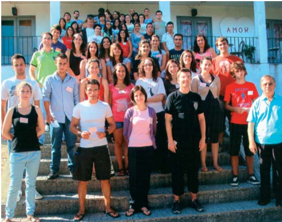
Convívio-Fraterno n.º 1131 da Zona Sul da diocese do Porto

Muitas vezes, o nosso dia a dia é um comboio de sensações que acelera fugazmente sem darmos conta, e sobre o qual não conseguimos mediar a velocidade, nem definir as paragens necessárias. A vida é, pois, um conjunto de vivências que existem, porque têm de existir... arrastando-nos para determinados contextos sem sabermos bem o porquê. A incerteza faz-nos “frios”, indiferentes, individualistas, egocêntricos... centramo-nos em nós, nas nossas pequenas coisas, nas coisas fúteis... andamos de olhos fechados para os outros e, conseqüentemente, de olhos fechados para nós mesmos.