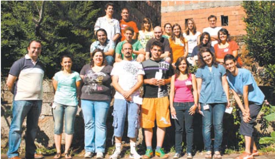
Convívio-Fraterno n.º 1129 da diocese de Vila Real